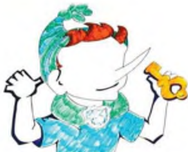
Рис. П2.3. Пример «Буратино»